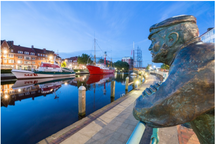
Delftspucker Hinni blickt auf den Ratsdelft